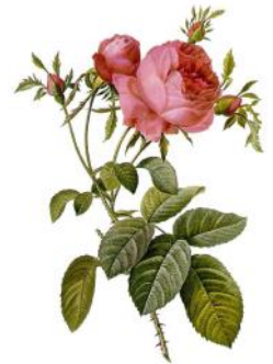
Bild: Pierre Joseph Redouté 1820

Auch Beiträge zu diesem Thema, seien es Lebensgeschichten oder schöne Gedichte, sind herzlich willkommen. Ausklingen lassen wir diesen "Rosen umrankten", nach Rosen duftenden Nachmittag bei Rosenbowle und feinem Gebäck.