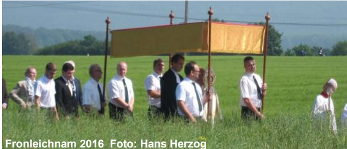
Fronleichnam 2016