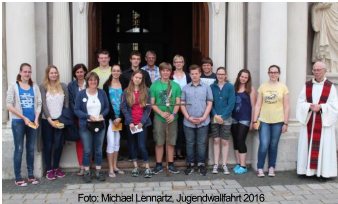
Jugendwallfahrt 2016

Hast du Lust, uns zu begleiten und viele neue Erfahrungen zu machen? Wir freuen uns auf dich!