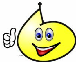
Grafik: CC by tsaios

Natürlich kommt der Humor nicht zu kurz. Das Prinzenpaar sitzt mit seinem Gefolge im Altarraum und alle, Kinder wie Erwachsene, sind karnevalistisch gekleidet.