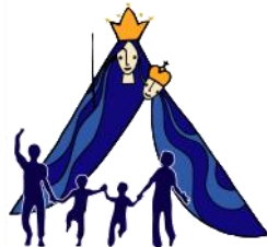
Kirche unterwegs Wallfahrt Kevelaer

Vielen Dank für seine Bereitschaft dazu!