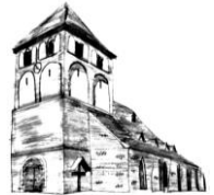
St. Martinus Barmen