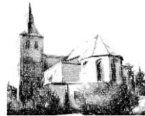
St. Martinus Kirchberg