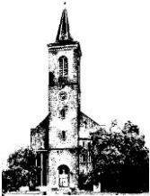
St. Barbara Schophoven