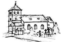
Hl. Maurische Märtyrer Bourheim