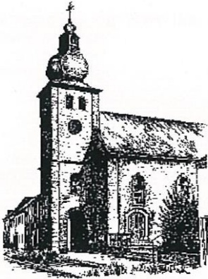
St. Philippus und Jakobus Broich